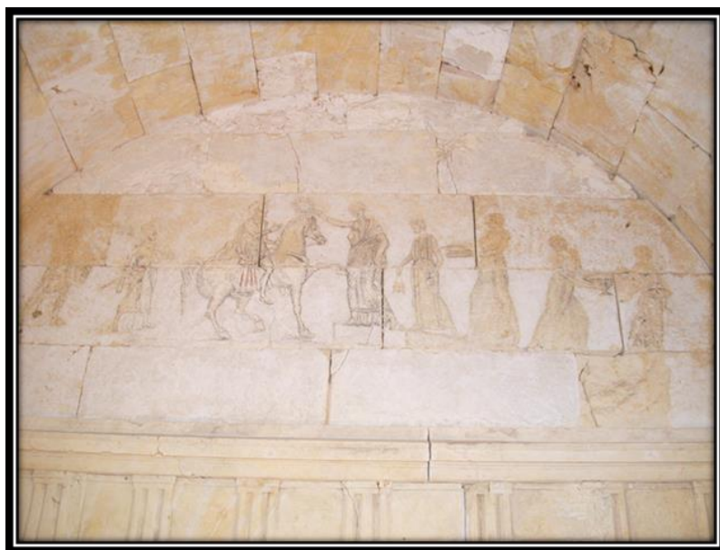
Обр. 4 – Снимка – люнетът на северозападната стена с композицията < https://www.museumisperih.com/(02.08.2022)> .