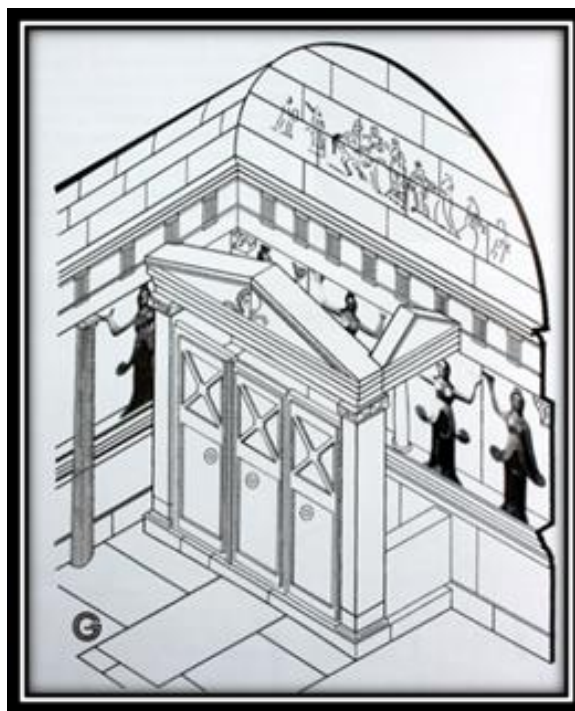
Обр. 5 – Триизмерна реконструкция на наискоса (Chichikova 2012, 60)

При легло № 1 са открити фрагменти от дъска и дървени струговани крака, от които е реставриран стол тип дифрос. Той е изработен от крушово дърво, без гръб и странични облегалки. Дифросът от Свещарската гробница е от често срещания се тип през IV – III в. пр. Хр. Той се свързва с мъжкото погребение, съобразно мястото му на намиране. В гробната камера на Казанлъшката гробница, която се датира във втората четвърт на III в. пр. Хр., дифросът е нарисуван в сцената с погребалното угощение, където мъжът е изобразен седнал на стол без облегалка/дифрос пред правоъгълна маса с три крака, а жената е на трон (Chichikova 2012: 56 s obr. 75 a-v).