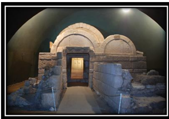
Обр. 2 – Снимка – общ изглед на гробницата в Гинаина могила < https://www.museumisperih.com/(02.08.2022)> .