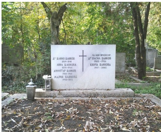
Семеен гроб на В. Цанков 15

Семеен. Със съпругата си Анна (1876 – 1966) имат син Васил. Синът му Васил Цанков се ражда на 2 април 1904 г. в Горна Оряховица, където баща му работи като ветеринарен лекар. Васил завършва Софийския университет и е известен български геолог и палеонтолог, с утвърдено име в българската наука (Haralanova, Rumenov, Slavcheva 2012: 123-125).