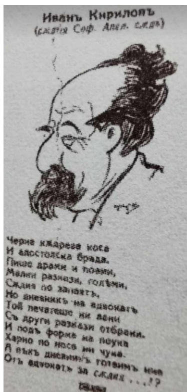
Шарж на Иван Кирилов 12

Въпреки че адвокатството не носи удовлетворение на Кирилов, той работи като съдия в Севлиево, Свищов, Трън, София и други населени места в България. На 28 февруари 1909 г., събота, съпругата му Лада, заедно с деветгодишното им момиченце Вяра отиват в пощата, изпращат няколко препоръчителни писма с прощално съдържание и се отправят към морския вълнолом, където се самоубиват (Svoboden glas, br. 10, 8 mart 1909). След самоубийството в семейството Иван Кирилов е преместен в Трън, където остава две години; после в Плевен и след много молби е върнат в София. Създава отново семейство и от него има три деца. До пенсионирането си през 1934 г. Ив. Кирилов работи в Апелативен съд, София.