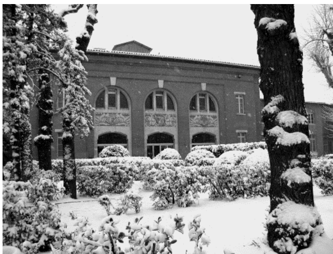
Старата сграда на Университета 3