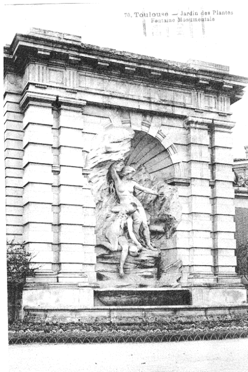
Пощенска картичка 1

Целта на настоящия наратив е да се проследи и прецизира българското представителство в учебните заведения в гр. Тулуза през учебната 1895 – 1896 г., като се направи просопографски анализ. Излизането на метода от полето на медиавистиката дава възможност да се проследи колективната биография на младите българи, избрала да получат висше или средно образование в Тулуза. В духа на генеалогията да се представят данни за отделните представители въз основа на родовата памет и взаимовръзка с рода в професионален, етнически, религиозен, образователен план и политическа активност. Същевременно е начин да се проследи реализацията след завършване и мястото в историческия развой на Третата българска държава.