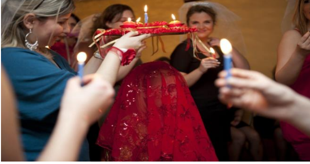
Resim 2: Kına Ritüeli ( https://www.google.com/search?q=kina+gecesi+resimleri eri Erişim tarihi 29.05.21.)