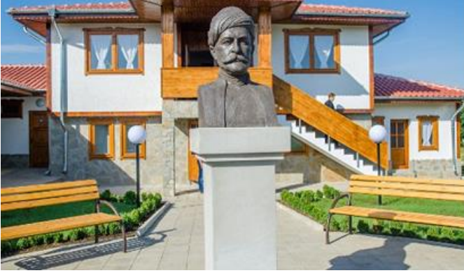
Fotoğraf 16 – Koca Yusuf Müzesi'nin bahçesinde bulunan büst heykeli

ilçesine bağlı Çerna (Karalar) köyünde açılan Koca Yusuf Evi Müzesi'nin bahçesinde yer almaktadır.