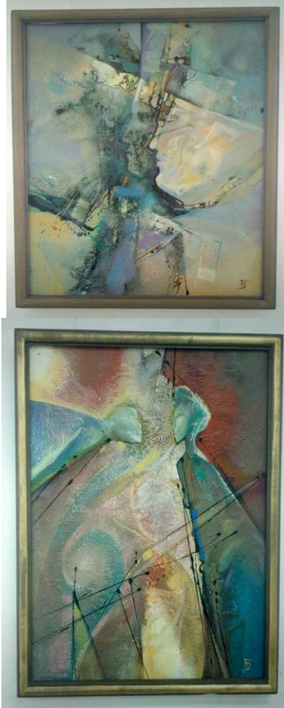
Fotoğraf 9, 10 ve 11 – 12. kişisel sergisinde yer alan eserlerden üçü