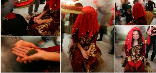
Resim 3. Kına Gecesi ( https://www.neoldu.com/kina-gecesi-gelenegi-nereden-geliyor-9036h.htm Erişim tarihi 06.06.21 )