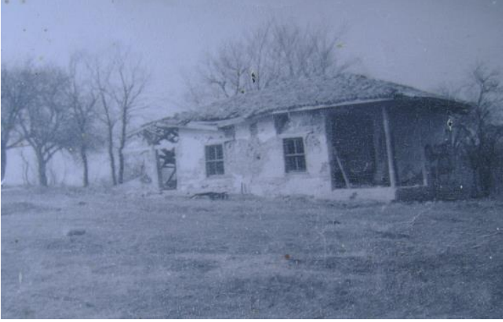
Resim 2: Tamir öncesi Karalar Tekkesi