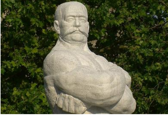
Fotoğraf 15 – Koca Yusuf heykelinin üst kısmı Sanatçı, efsane güreşçi Koca Yusuf'un heykeli ile yetinmeyerek 2015'te büst heykelini ve rölyefini de yapar. Büst heykeli, 6 Eylül 2015'te Şumen'in Hitrino