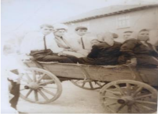
Resim 6. Gelin öküz arabasıyla alınmış, arabaya sadece erkek tarafından binilmiş.