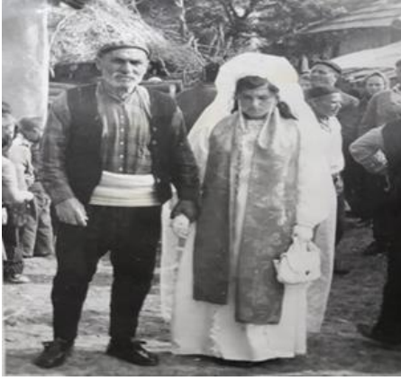
Resim 5. Kızın babası, kızını arabaya bindirmeye götürürken.