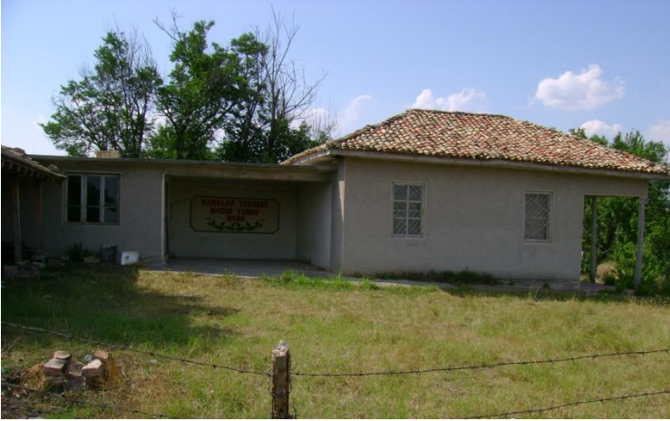
Resim 3: Karalar Tekkesi bugün