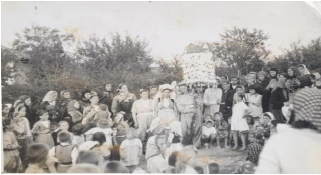
Resim 7: 1960'lı yıllarında mum töreni.

oyunlar, sonra mumu oğlanın annesine ve babasına götürürler, evin bir köşesine süslü dalı (mumu) koyarlar (Resim 7). Çarşamba akşamı mum verildikten sonra davullar vurulmaya başlar, herkes oynamaya başlar, davullar gece geç saate kadar vurulur. Gece vakti saat onbir(11) olunca dakı tutulur (hediye takma merasimi), gelin dakıya katılmaz. Bitince de herkes evlerine dağılır.