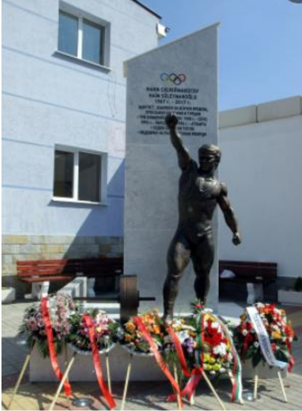
Fotoğraf 22 – Momçilgrad’da (Mestanlı) dikilen “Cep Herkülü” lakaplı Naim Süleymanoğlu’nun heykeli

Bulgaristan Ressamlar Birliğine ve Şumen Ressamlar Derneğine üye olan Behçet Danacı, 2009 ve 2010 yılında “Yılın Öğretmeni” ödülü alır.