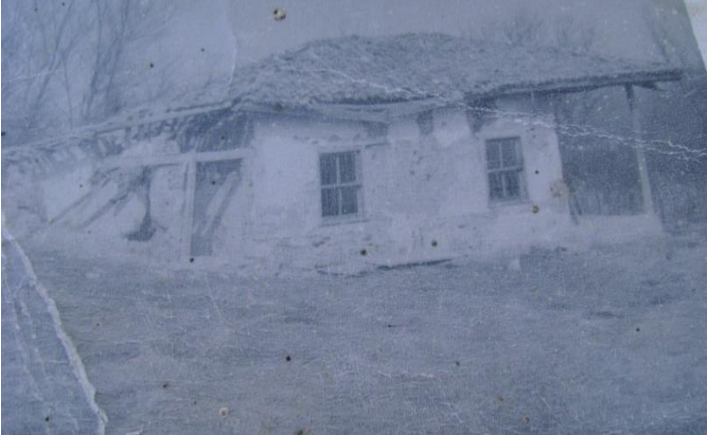
Resim 1: Tamir öncesi Karalar Tekkesi