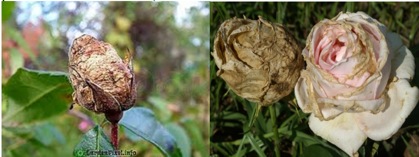
Снимка 4. Сиво гниене ( Botrytis cinerea ) по розата.

Сивото гниене ( Botrytis cinerea ) се среща повсеместно, но вреди в години с умерени температури и чести превалявания. Обикновено засяга цветните бутони и връхчетата на младите летораста, които покафеняват и засъхват (снимка 4). При влажно време нападнатите части се покриват с обилен сивкав налеп от мицел и спори на гъбата. Разсейвайки се, спорите причиняват вторични заразявания и болестта се разпространява бързо в насаждението. Сивото гниене е опасно и за резниците по време на вкореняване, които загиват. Гъбата зимува като склероции в почвата и като склероции и мицел по растителните остатъци.