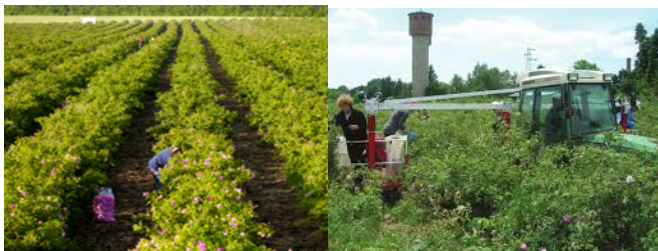
Снимка 3. Розобер.