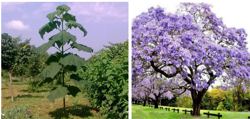
Снимка 1. Пауловния.

Дълбоко разположената коренова система на пауловния позволява засаждане на култури с по-повърхностно разположени корени в междуредията ѝ. Тя влияе благоприятно на другите растения като намалява скоростта на вятъра (с 21-52 %). Намаляването на скоростта на вятъра през зимата спомага за повишаване на температурата на околния въздух с до 1°C, а през лятото - поради сянката на дърветата, температурата може да се намали със същата стойност.