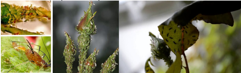
Снимка 9. Листни въшки по розата.

бутоните и младите леторасты. Вредят като смучат сок от нападнатите леторасты. Най-големи повреди нанасят през юни и юли, когато колонии от въшки се концентрират по младите леторасты и силно затормозяват тяхното развитие. Нападнатите части увяхват, обезцветяват се, деформират се и спират развитието си. Отначало изсъхват отделни стъбла, а впоследствие и цялото растение. За появата и развитието на въшките благоприятно влияние оказва сухото и топло време. Те се развиват през целия вегетационен период и имат много поколения. При благоприятни условия се размножават масово и образуват гъсти колонии (снимка 9).