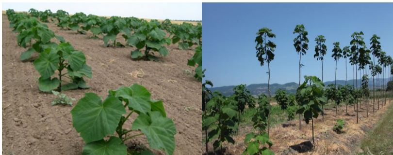
Снимка 2. Насаждение от пауловния.