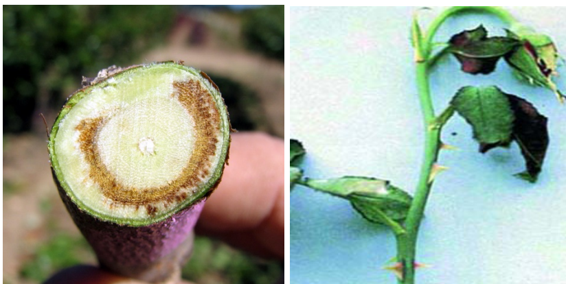
Снимка 6. Вертицилийно увяхване ( Verticillium dahliae ; V. albo-atrum ) по розата.