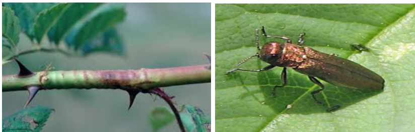
Снимка 7. Агрилус по розата ( Agrilus cuprescens ).

Пъпковата перокрилка ( Platiptilia rhododactyla F.) е специфичен неприятел по маслодайната роза. Повредите по розата се причиняват от презимувалите гъсеници, които напускат местата на зимуване едновременно с разпукването на пъпките през май. Те се вгризват във върховете на пъпките, като правят малки кръгли отвори. Отначало се хранят с недоразвитите се листчета, а по-късно унищожават изцяло пъпката. Перокрилката оплита цветните пъпки и прилистниците около тях с леплива паяжина (снимка 8). При масово нападение оплита цялото съцветие заедно с листата, което по-късно изсъхва. Развива едно поколение годишно и зимува като гъсеница от първа възраст в плътен пашкул по различни части на розовия храст.