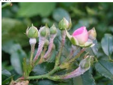
Снимка 2. Брашнеста мана по розата.

Черните листни петна ( Diplocarpon rosae Wolf.) се появяват по листата, в резултат на което те окапват, а добивът от розов цвят силно намалява (снимка 3). В резултат на това се събуждат спящи пъпки, растенията отслабват и стават чувствителни на измръзване през зимата. През лятото и есента по горната страна на листата се наблюдават единични или няколко на брой големи, неправилно закръглени, първоначално червеникави, а по-късно тъмнокафяви до черни на цвят петна. Около петната тъканите започват да жълтеят и листата окапват. Болестта се проявява в дъждовно време или при изобилни и чести