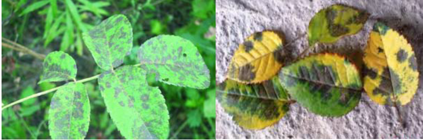
Снимка 3. Черни листни петна ( Diplocarpon rosae Wolf.) по розата.

роси. Особено силно се нападат отслабени растения. Гъбата презимува в заразнените растителни остатъци.