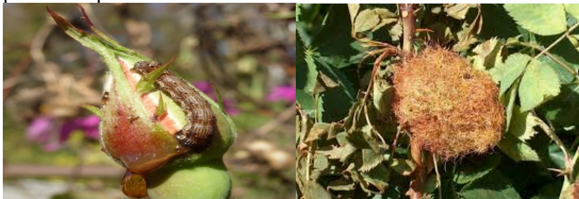
Снимка 8. Пъпкова перокрилка ( Platiptilia rhododactyla F.).

Пъпковата перокрилка ( Platiptilia rhododactyla F.) е специфичен неприятел по маслодайната роза. Повредите по розата се причиняват от презимувалите гъсеници, които напускат местата на зимуване едновременно с разпукването на пъпките през май. Те се вгризват във върховете на пъпките, като правят малки кръгли отвори. Отначало се хранят с недоразвитите се листчета, а по-късно унищожават изцяло пъпката. Перокрилката оплита цветните пъпки и прилистниците около тях с леплива паяжина (снимка 8). При масово нападение оплита цялото съцветие заедно с листата, което по-късно изсъхва. Развива едно поколение годишно и зимува като гъсеница от първа възраст в плътен пашкул по различни части на розовия храст.