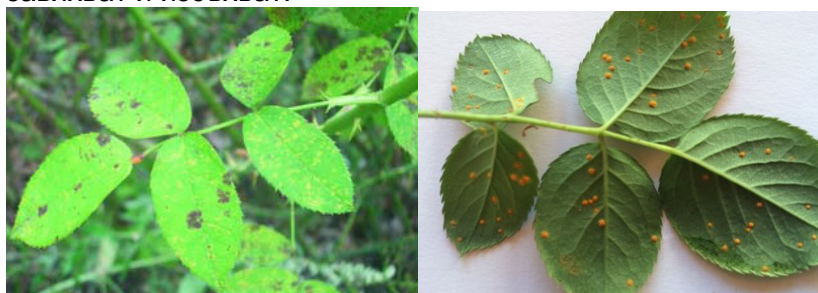
Снимка 1. Ръжда ( Phragmidium mucronatum Pers.) по розата.

Ръждата ( Phragmidium mucronatum Pers.) е икономически най-важната болест по маслодайната роза. Предизвиква масов преждевременен листопад и забавя узряването на леторастите, поради което те лесно измръзват през зимата. През следващата година оцелелите храсти се развиват слаби и често изсъхват. Причинителят е еднородна ръжда, която развива всичките си стадии върху розата. Напада зелените части на растенията. През пролетта се появяват оранжеви петна по листата, клонките и цветовете с големина от малки точки до петна с диаметър 2-3 см (снимка 1). На мястото на петната, от долната страна на листата, се формират оранжеви купчинки от уредоспори. Към края на лятото се появяват черни, прашести купчинки от телеитоспори. Болните растения постепенно отслабват, завяхват и изсъхват.