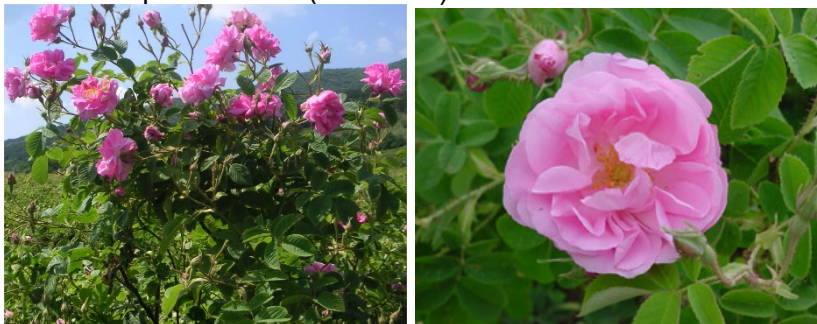
Снимка 1. Маслодайна роза ( Rosa damascena Mill.).

Маслодайната роза ( Rosa damascena Mill.) е многогодишен храст, чиято надземна част достига 1,5 –2 м и е силно разклонена (снимка 1).