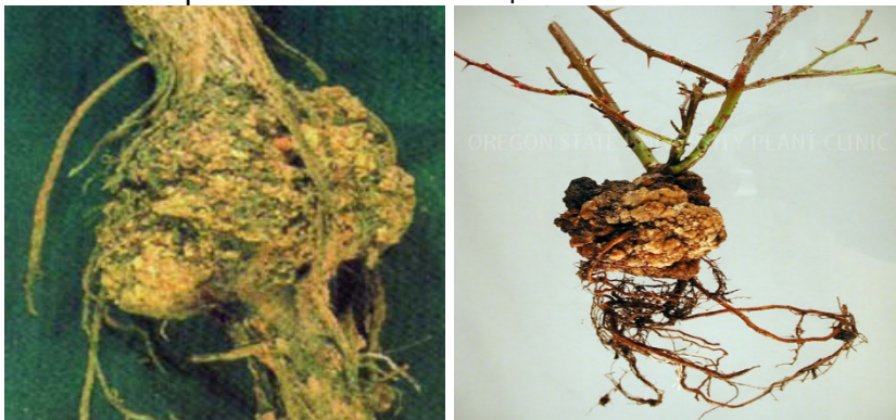
Снимка 5. Бактериен рак по розата.

По корените, кореновата шийка и по-рядко по стъблата се образуват дребни, гладки, светложълти тумори (снимка 5). Те се разрастват, повърхността им става грапава, добиват зърнест строеж и цветът им се променя в тъмнокафяв. Болните растения са с потиснато развитие и често измръзват през зимните месеци. Причинителят на заболяването прониква в растенията през рани. Бактерията е полифаг и напада редица културни и диви растения от различни ботанически семейства. Бактерията се запазва в почвата и в растителните остатъци.