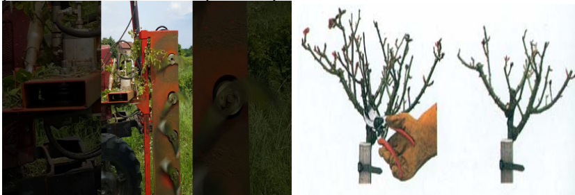
Снимка 2 Резитба на розата.

способства за намаляване височината на храста и увеличаване на добива с 46,4%. Резитбата влияе чувствително върху възстановяване жизнеността на растенията, удължаване експлоатационния им период, увеличаване средното тегло на цвета и дневната производителност при брането с 35,7%. Препоръчва се резитбата да се извършва през 3 години.